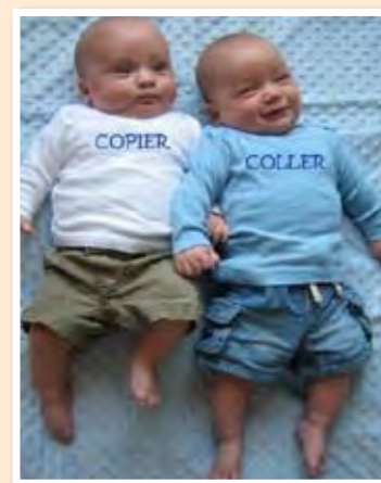
de vrais jumeaux

Les jumeaux fraternels (70 %) sont plus communs que les vrais jumeaux (30 %). Dans le cas des jumeaux fraternels, deux œufs sont fécondés. Toutefois, dans le cas des vrais jumeaux, un œuf fécondé se dédouble pour donner des jumeaux identiques à la naissance. La photo ci-dessus est une autre façon de faire comprendre ce que sont de vrais jumeaux. Il y a 20 ans, aurait-on compris le message transmis par cette photo?